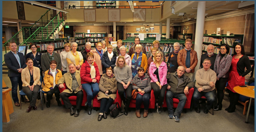
Spotkanie plenarne Longford Municipal District Public Participation Network, luty 2020 r.

PPN bardzo dobrze radzi sobie z przekazywaniem informacji do wszystkich członków i grup. Wykorzystuje wszystkie środki komunikacji przez telefon, e-mail, pocztę, a teraz przez wirtualne spotkania, aby utrzymać nas na bieżąco, jeśli chodzi o nowe projekty lub działania, które mają miejsce w społeczności.»