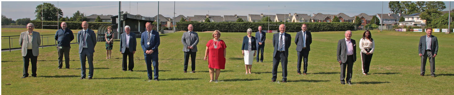
Rada Hrabstwa Longford, 2021. Wybrani radni sfotografowani z zespołem administracyjnym i administratorem zgromadzenia.