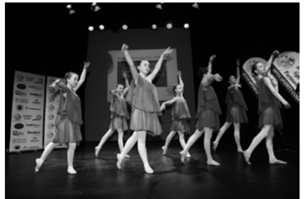
Scoil Damhsa Peelo

Leanann Comhpháirtíocht Spóirt an Longfoirt ar aghaidh, i gcomhar leis an FSS, ag cuidiú leis an Tionscnamh Marcála Clós Súgartha atá á chur i bhfeidhm i mbunscoileanna sa Longfort.