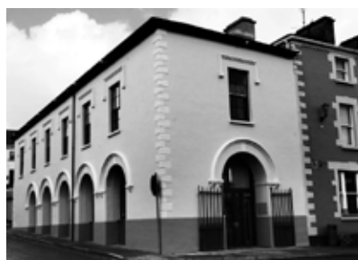
The newly refurbished Grand Library 2014