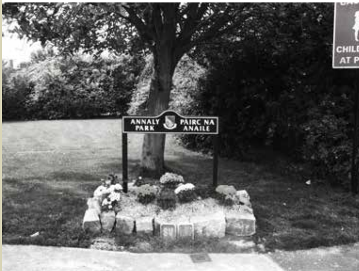
Páirc na hAnaile, An Longfort