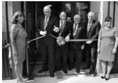
Official Reopening of Grand Library 2014

Tá an-tóir ag scoileanna agus grúpaí pobail freisin ar an Seomra Cúirte a bhfuil athchóiriú álainn déanta air ar an gcéad urlár, agus bíonn a lán imeachtaí ar siúl i rith na seachtaine lena n-áirítear léachtaí, club leabhar agus clár sé seachtaine faoi thuiscint na healaíne atá a réachtáil i gcomhar le Bantracht na Tuaithe, Gránard. I measc na bpríomhimeachtaí bhí ócáid na gcarúl Nollag do dhaoine scothaosta sa phobal, a réachtáladh i gcomhar le hIonad Acmhainní Rath Mhuire.