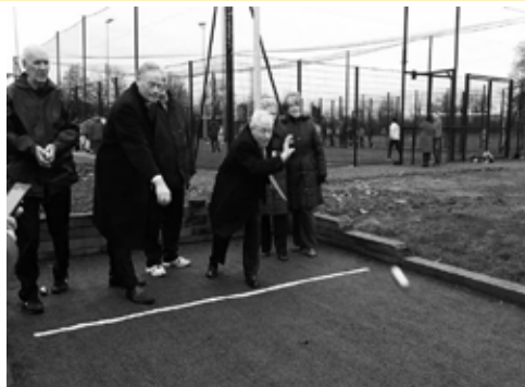
An tÁire Ring agus an Teachta Dála Bannan agus an Chúirt Bocce agus an Limistéar Ilúsáide Cluichí á seoladh acu (Nollaig 2014)

Having secured funding under the SportNation fund in 2013 on behalf of the Longford County Council, an Outdoor Bocce Court and Multi-Use Games Area (MUGA) were opened in the Mall, Longford Town.