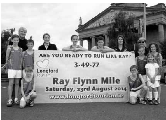
Operation Transformation, 'Slí na Sláinte' ag an gcanáil.