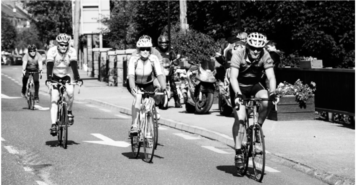
Turas Rothaíochta an Longfoirt – rothaithe na slí 100km i mBaile Uí Mhatháin

Bhí Turas Rothaíochta an Longfoirt ar siúl i mí an Mheithimh mar chuid de Sheachtain Náisiúnta na Rothar, agus bhain thart ar 200 rannpháirtí taitneamh as an rogha trí bhealach ar fud an Longfoirt – 15km, 50km agus 100km. Cuireadh an turas ar siúl i gcomhpháirtíocht le Club Rothaíochta an Longfoirt. Thacaigh Comhpháirtíocht Spóirt an Longfoirt leis an Lá 'Téigh ag an Obair ar do Rothar', leis an Lá 'Téigh ar Scoil ar do Rothar' agus le ceardlanna Cyclesafe freisin. Reáchtáladh na himeachtaí sin i gcomhar le Comhairle Contae an Longfoirt agus leis an Údarás um Shábháilteacht ar Bhóithre.