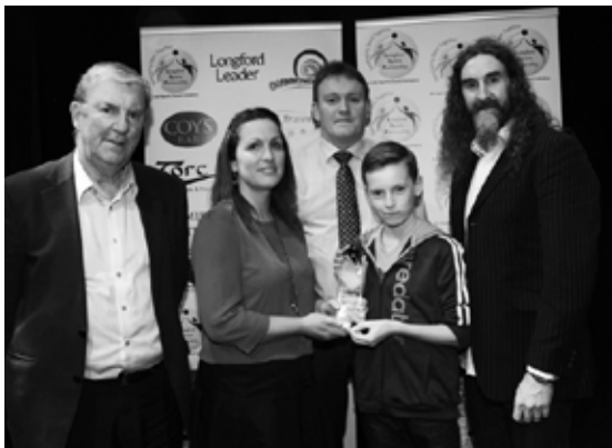
Gasúr Spóirt na Bliana