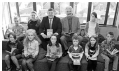
Summer Reading Buss 2014

Tá ár gcuid leabharlann bhrairse fós ina bpointe fócasach i leith shaol an phobail sa cheantar áitiúil, agus baineann go leor grúpaí agus daoine aonair leas as na háiseanna agus na seirbhísí atá ar fáil. Bíonn a lán tionscadal agus imeachtaí spreagúla, lena n-áirítear taispeántais, léachtaí, ócáidí léimh agus seoltaí leabhar, chomh maith le ranganna teanga agus ranganna ríomhaireachta, ar siúl sna leabharlanna brainse ar fud an chontae. Tá an dearcadh ann i leith na leabharlaine gur spás don phobal í, agus go bhfuil rochtain ag gach saoránach i gContae an Longfoirt uirthi. Tá sí fós i mbun comhpháirtíochtaí tábhachtacha a bhunú le soláthraithe seirbhísí agus gníomhaireachtaí reachtúla agus pobail eile sa chontae lena n-áirítear – Nasc na mBan, An Longfort (LWL), Líonra Daoine Scothaosta an Longfoirt, Bord Oideachais agus Oiliúna an Longfoirt agus na hIarmhí, Cumann Meabhairshláinte an Longfoirt, FSS, agus a lán grúpaí pobail eile.