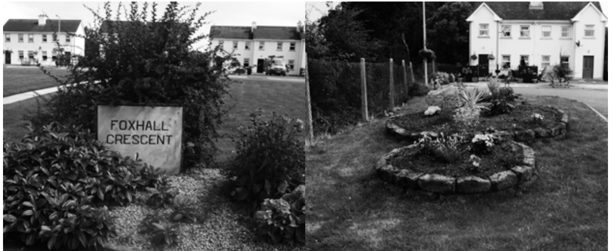
An Buaiteoir Foriomlán - Corrán an Rátha Riabhaigh, An Liagán

Bhí 'Gradaim na nEastát is Fearr' ar siúl arís in 2014.