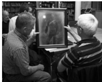
Image taken during the Great War Memorabilia Open Day during Heritage Week 2014.

Clár ceithre bliana is ea an Comóradh ar ról an Longfoirt sa Chogadh Mór chun comóradh a dhéanamh ar an gcéad Cogadh Domhanda agus ar an tionchar a bhí aige ar Chontae an Longfoirt. Roimh 2014, is beag feasacht a bhí ann i measc an phobail faoin 360+ fear agus bean ón Longfort a fuair bás de bharr an Chogaidh Mhóir. Sa chéad bhliain seo den chomóradh, d’éirigh linn a lán daoine eile a shainiú, agus cuireadh ar a gcumas do dhaoine muinteartha leo a gcuid scéalta a chomhroinnt den chéad uair. Forbraíodh sraith imeachtaí agus tionscadal chun cur leis an bhfeasacht, lena n-áirítear taispeántas a bhí ar siúl ó Sheachtain na hOidhreachta go dtí mí na Samhna 2014, laethanta oscailte d’earraí cuimhneacháin cogaidh (sa phictiúr), imeachtaí cuimhneacháin, cur scannán ar an scáileán agus cainteanna le staraithe áitiúla ar ghnéithe den Chogadh Mór agus muintir an Longfoirt a bhí páirteach ann. Leanfar leis na himeachtaí sin agus cuirfear leo gach bliain go dtí 2018 agus ina dhiaidh sin.