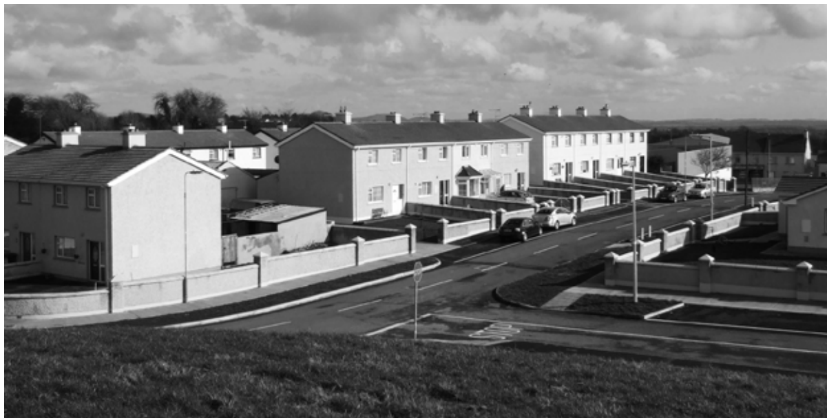
Bóthar Thromraí, Gránard

In 2012, ceadaíodh buiséad €1.65 milliún chun Oibreacha Feabhais a dhéanamh ag Bóthar Thromraí, Gránard. Is éard a bhí i gceist sa tionscadal sin ná athghiniúint 41 teaghais. Tithíocht shóisialta is ea trí cinn is tríocha (33) de na teaghaisí sin agus tá na hocht gcinn eile faoi úinéireacht phríobháideach. Cuireadh tús leis na hoibreacha i Márta 2013 agus bhí siad críochnaithe faoi lár na bliana 2014.